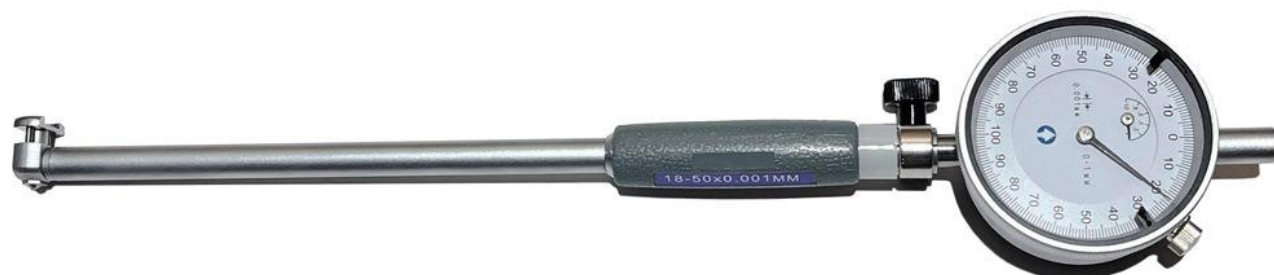
Рисунок 2 – Общий вид нутромеров модели НИ-ПТ