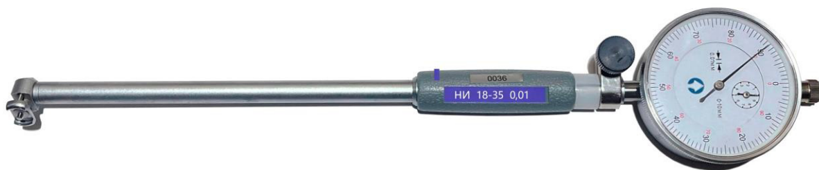
Рисунок 1 – Общий вид нутромеров модели НИ