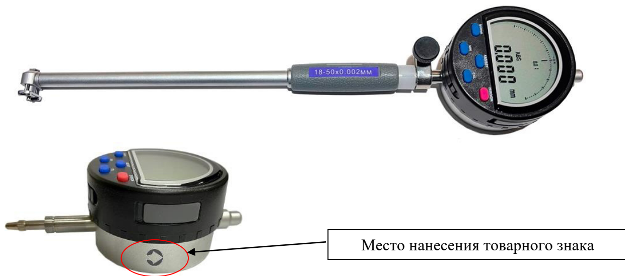
Рисунок 3 – Общий вид нутромеров модели НИЦ-ПТ