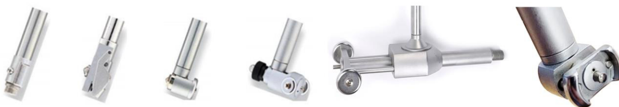
Рисунок 4 – Общий вид измерительных наконечников нутромеров