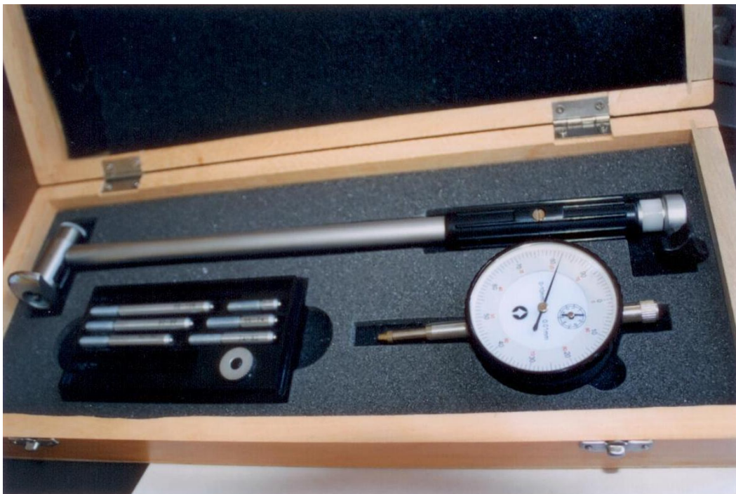
Рисунок 1 - Общий вид нутромера индикаторного Diarazon.

Измерение нутромером происходит двухточечным контактом с измеряемой поверхностью относительным методом. Отсчетное устройство – измерительная головка с ценой деления 0,01 мм. Для совмещения линии измерения с осевой плоскостью измеряемого отверстия нутромеры снабжены центрирующим мостиком. Измерение требуемого размера обеспечивается с помощью одного из входящих в комплект сменных стержней. Настройка производится по аттестованным установочным кольцам или блокам концевых мер длины с боковиками.